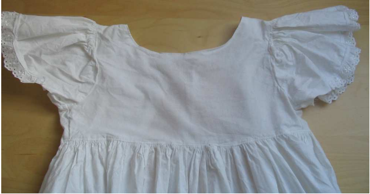
Voorkant Sienschortje met kapmouwtjes