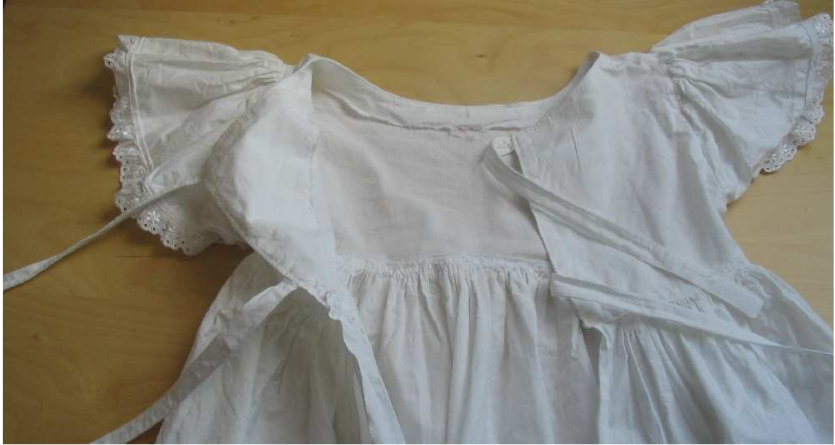
Achterkant Sienschort (open, met beleg aan de binnenkant)