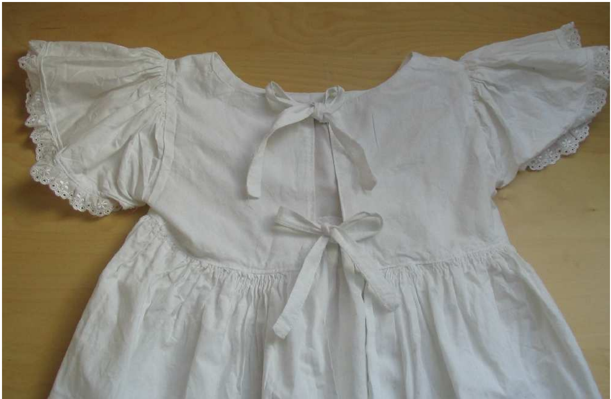
Achterkant Sienschort met strikssluitingen